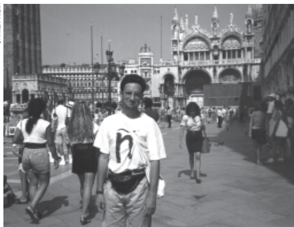
Se trata de «ser quién soy y cómo soy, o no ser.